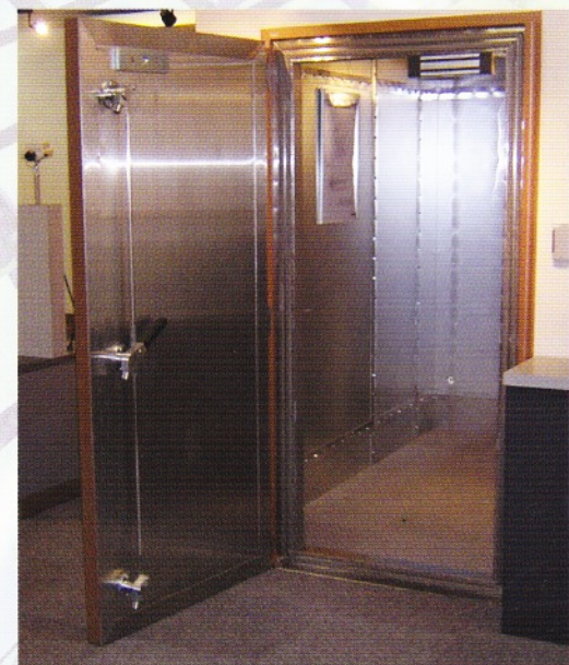
グレモンシールドドア(室内シールドパネル仕様)