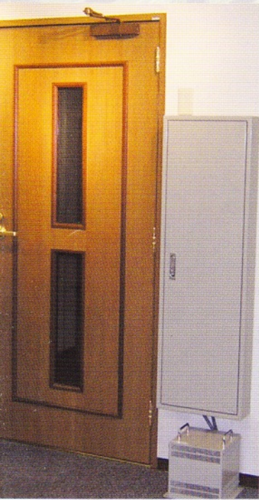
ワイヤレスシールドドア(木質タイプ) 40dB