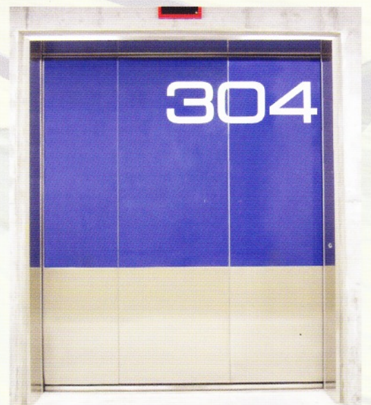
大型シールドスライドドア(電動仕様)正面