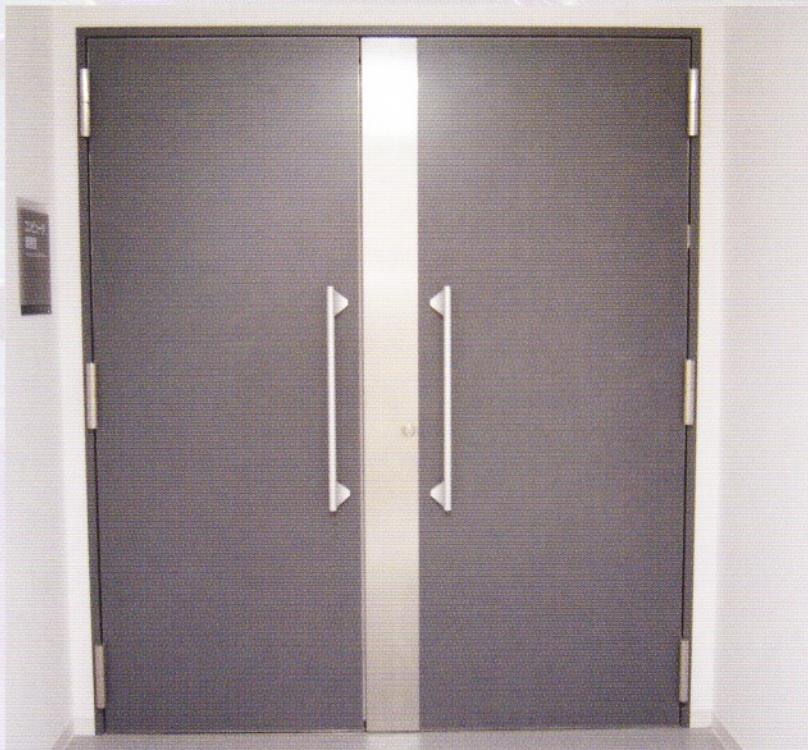
グレモンレスシールドドア(電気錠付)外観 40~60dB

Howa の電磁シールドドア「エムブロック」はこれらの電磁波を遮断し、重要な情報の漏洩を防ぎ、快適な空間を提供致します。