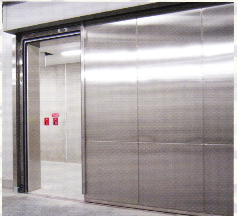
大型シールドスライドドア(電動仕様) 40dB