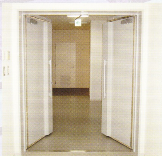
グレモンレスシールドドア(電気錠付)内観