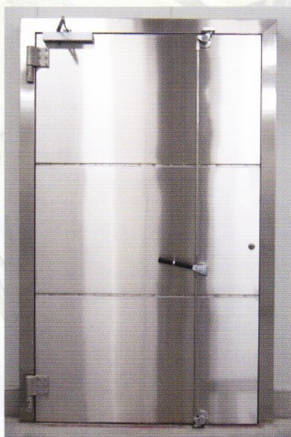
保温機能付シールドドア 40dB